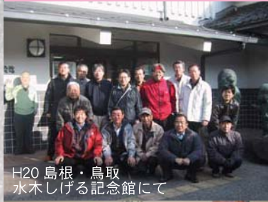
H20 鳥根・鳥取 水木しげる記念館にて