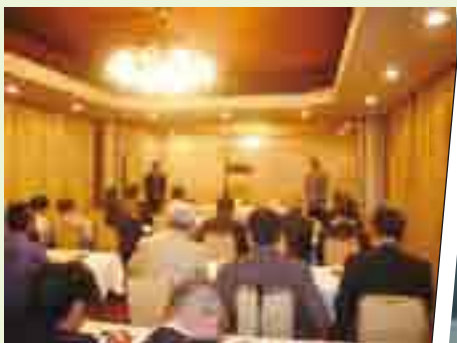
平成26年4月23日通常総会