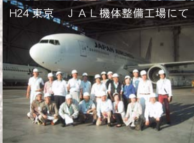
H24 東京 J A L 機体整備工場にて

伊勢支部では、ほぼ毎年視察研修旅行を企画・実施しています。主に国内のバス旅行で、建物等の視察見学で見聞を深め、また皆さんが和気あいあいと親睦を深める機会となっています。