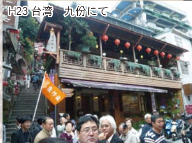
H23 台湾 九份にて