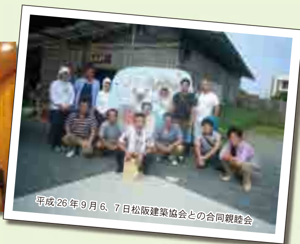
平成26年9月6,7日松阪建築協会との合同親睦会