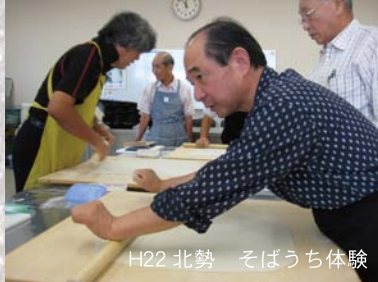
H22 北勢 そばうち体験